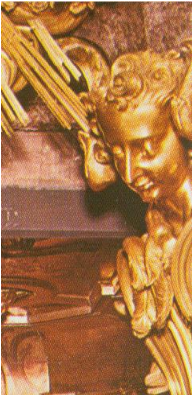
Engel aus dem Heiligtum von Caravaggio

Die Giovannetta aus Müstair dagegen gleicht dem älteren Vorbild auf dem grafischen Stich. Auch sind ihre Hände gefaltet wie auf den früheren Darstellungen. Im Gegensatz zum Gelenkkopf und den Händen der Madonna scheint sie von einem ländlichen Schnitzer in Müstair im 19. Jahrh. passend zu Kopf und Händen des Madonna geschaffen worden sein. Damit konnten die ersten Patres aus Caravaggio kommend ihr Gnadenbild in Müstair wieder vervollständigen.