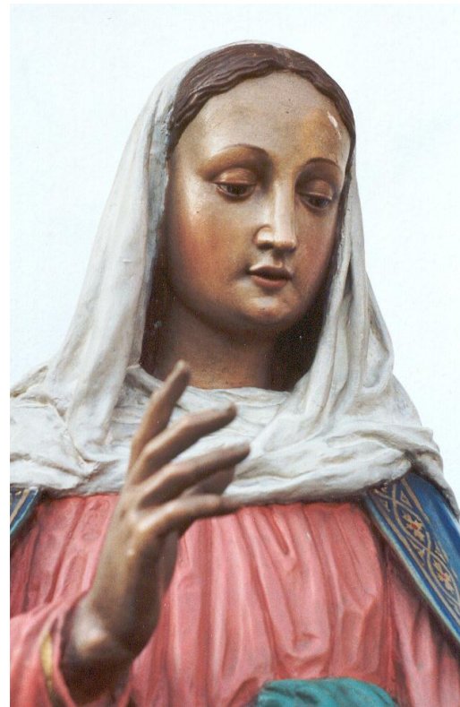
Kopf und Hand der Madonna aus Müstair

Wenn man sich bei der Madonna aus Müstair die später aufge kitteten Haare und den Schleier aus Gips und Tuch wegdenkt, so ist die Ähnlichkeit mit der originalen Engelsskulptur von 1735 überraschend. Mit gutem Grund darf man sich fragen ob Haupt und Hände der Madonna von Müstair zur Zeit Napoleons in Caravaggio evakuiert wurden und zu den Heiligtümern gehörten, die, wie man uns sagte, in entlegene Bergtäler geflüchtet wurden. In Müstair jedenfalls ist überliefert, dass die Madonna (Kopf und Hände) von den ersten Patres von Caravaggio nach Müstair gebracht wurde.